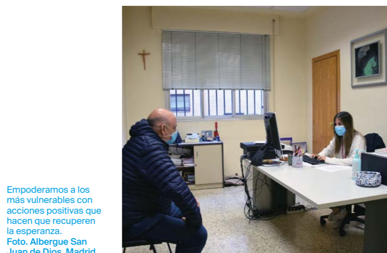
Empoderamos a los más vulnerables con acciones positivas que hacen que recuperen la esperanza.