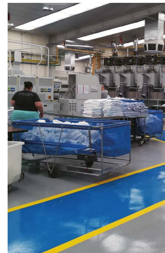
Damos oportunidades a los que no las tienen para que se sientan útiles.