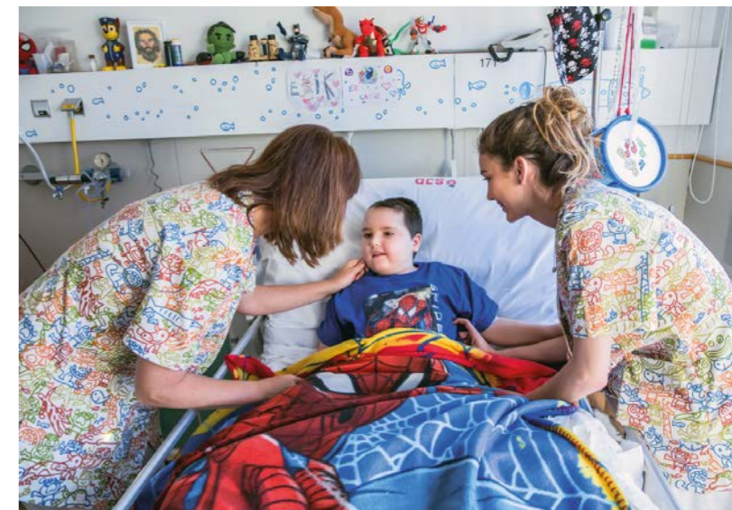
Siempre al lado del que sufre para aliviar y acompañar.