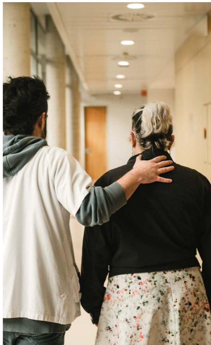
La atención a los trastornos de salud mental siempre ha sido una categoría particular en nuestras obras, dada la experiencia biográfica de nuestro Fundador.

nes y, por encima de todo, tienen los mismos derechos que cualquier otra.