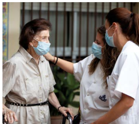
A los profesionales de los centros y fundaciones de San Juan de Dios les mueve la Hospitalidad.